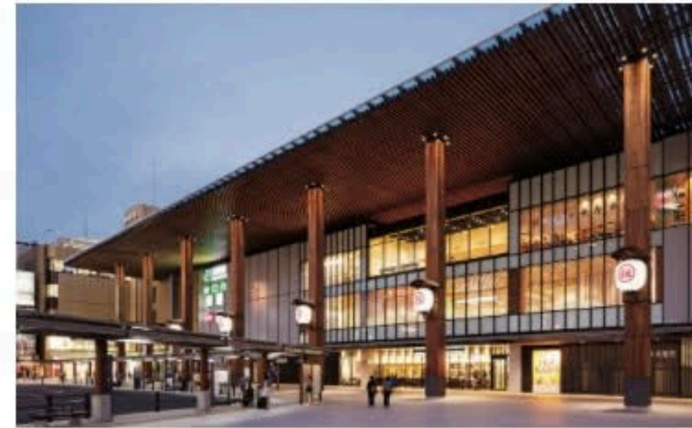
長野駅善光寺口開発：駅前広場、駅改良、商業 2017都市景観大賞（国土交通大臣賞）

1999年JR東日本入社。入社後、駅改良や住宅開発などを担当。2003年に総合建設会社に出向し国内PFI事業に携わる。その後、本社にて10年以上にわたり、商業施設、オフィス、ホテル等の多くTOD案件の計画および開発に携わる。2015年に秋田駅周辺計画を立上げ、約3年間、現地にて地方創生型のTODを実践。2018年に本社に戻り、地域開発等のTOD開発の全般を担当している。1999年東京工業大学社会工学科卒業。2007年早稲田大学ファイナンス研究科MBA（ファイナンス修士）取得。2013年東京大学大学院まちづくり大学院修了。